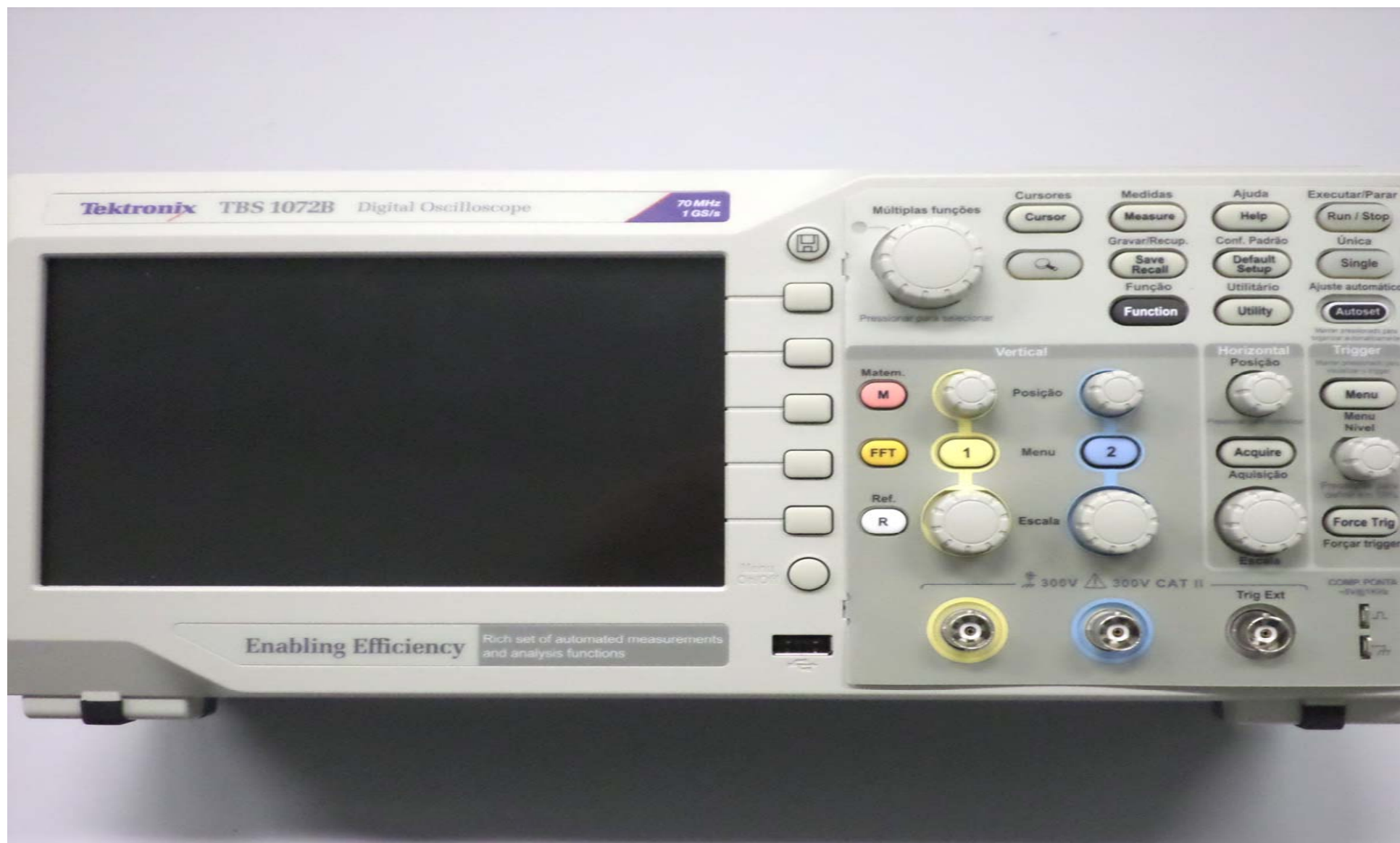
FIGURA 1 - Osciloscópio Digital, 70 MHz, amostragem 1GS/s, modelo TBS1072 B, marca TEKTRONIX