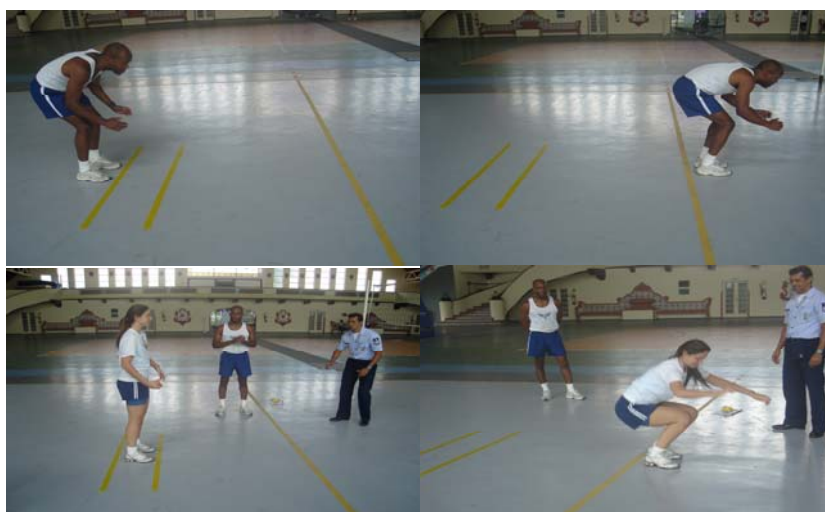
Figura 3 - Teste de salto horizontal

Obs.: Neste teste, serão exigidos os mesmos padrões de execução para ambos os sexos