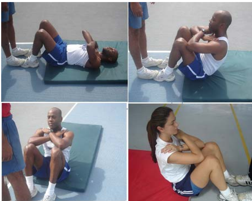
Figura 2 - Flexão do tronco sobre as coxas

Obs.: Neste teste, serão exigidos os mesmos padrões de execução para ambos os sexos.